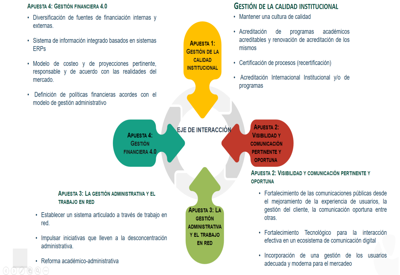
Gráfico 7. Pilar 5: Eje de Interacción

sistema interno de aseguramiento, no solamente orientado a los procesos misionales sino también a los procesos estratégicos y de apoyo a la gestión institucional. Nuestras apuestas en este eje serán: