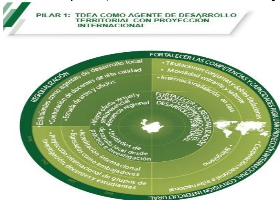
Gráfico 2. Pilar 1: TdeA + Territorio

Articular la regionalización y la internacionalización con proyectos estratégicos que aporten a la transformación de los territorios y de las personas desde la formación, la investigación y la extensión.