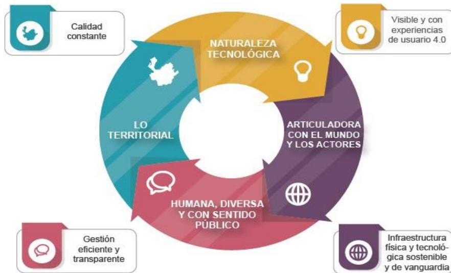
Gráfico 1. Pilares de la propuesta