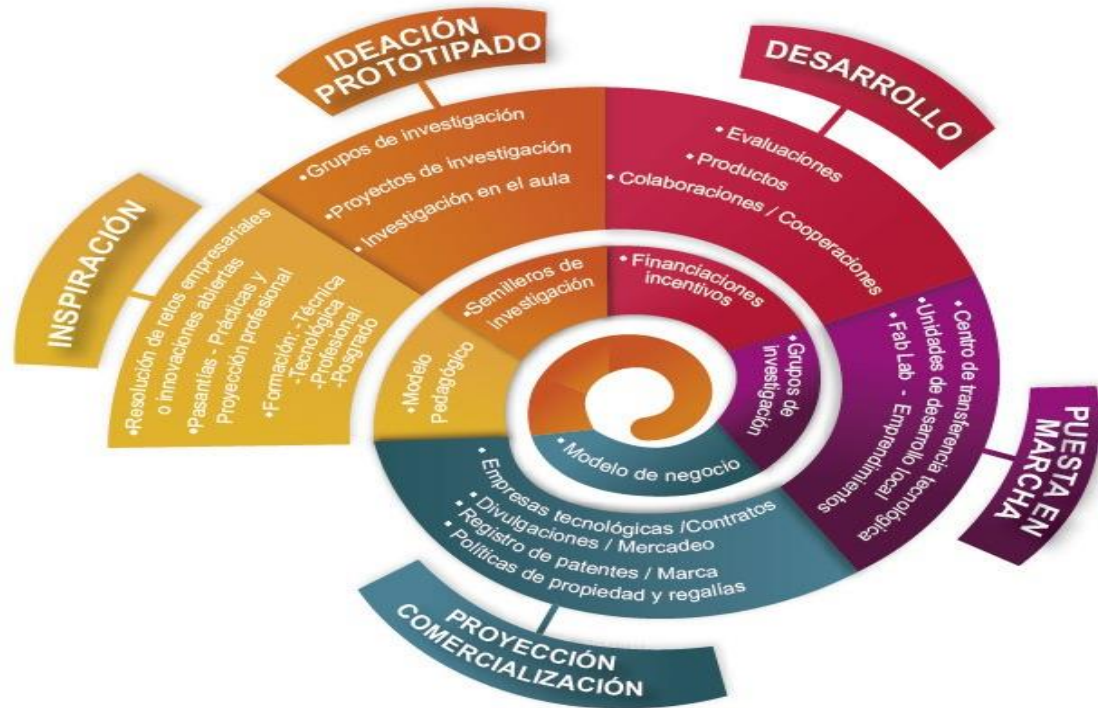
Gráfico 4. Pilar 2: TdeA + Innovador + Tecnológico