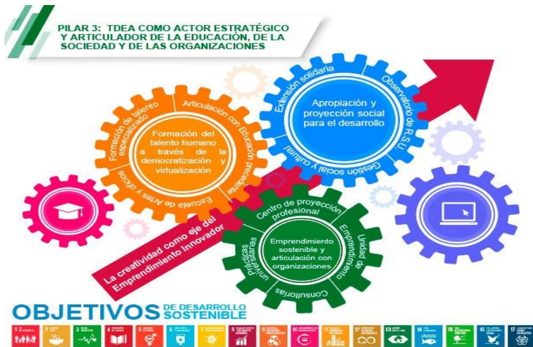
Gráfico 5. Pilar 3: TdeA + Articulado con el mundo y los actores