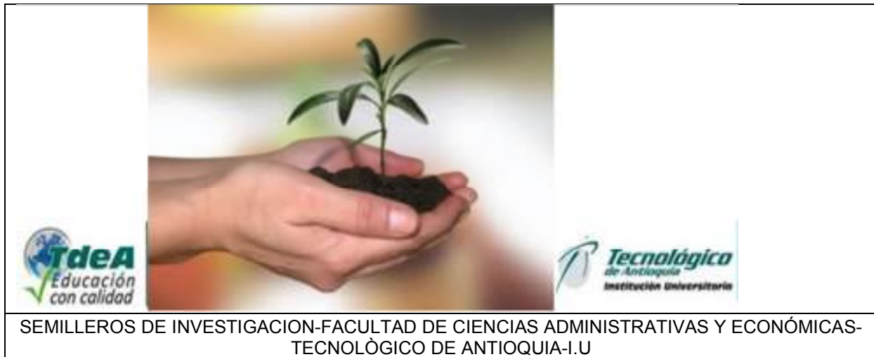
Ilustración 4: Semilla