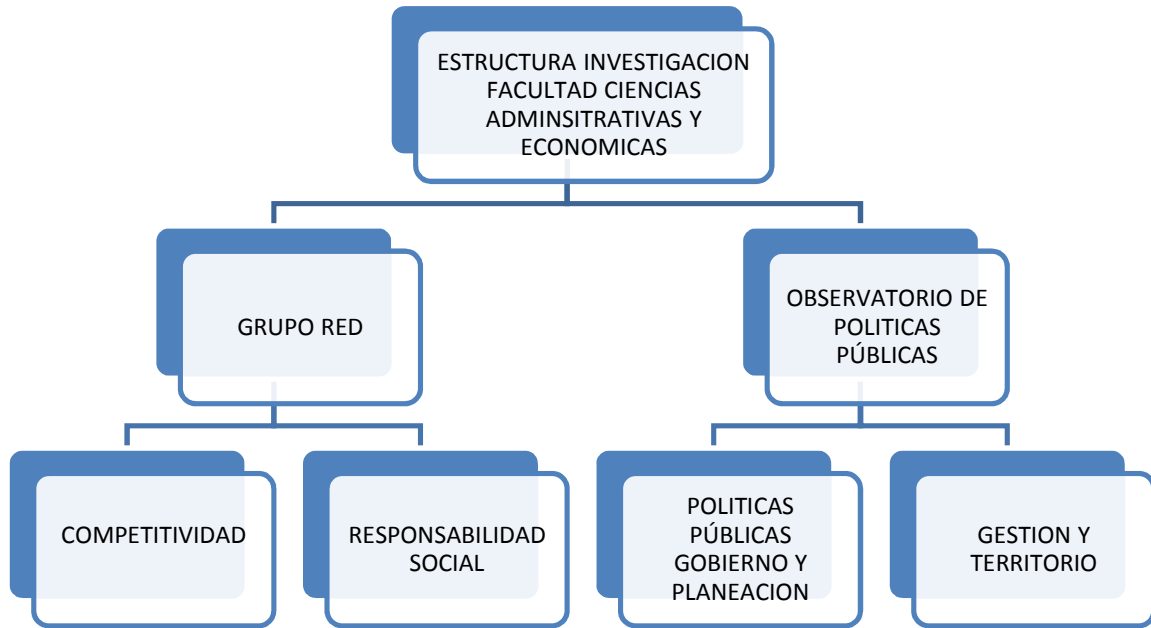
Ilustración 3: Estructura de Investigación de la Facultad de Ciencias Administrativas y Económicas