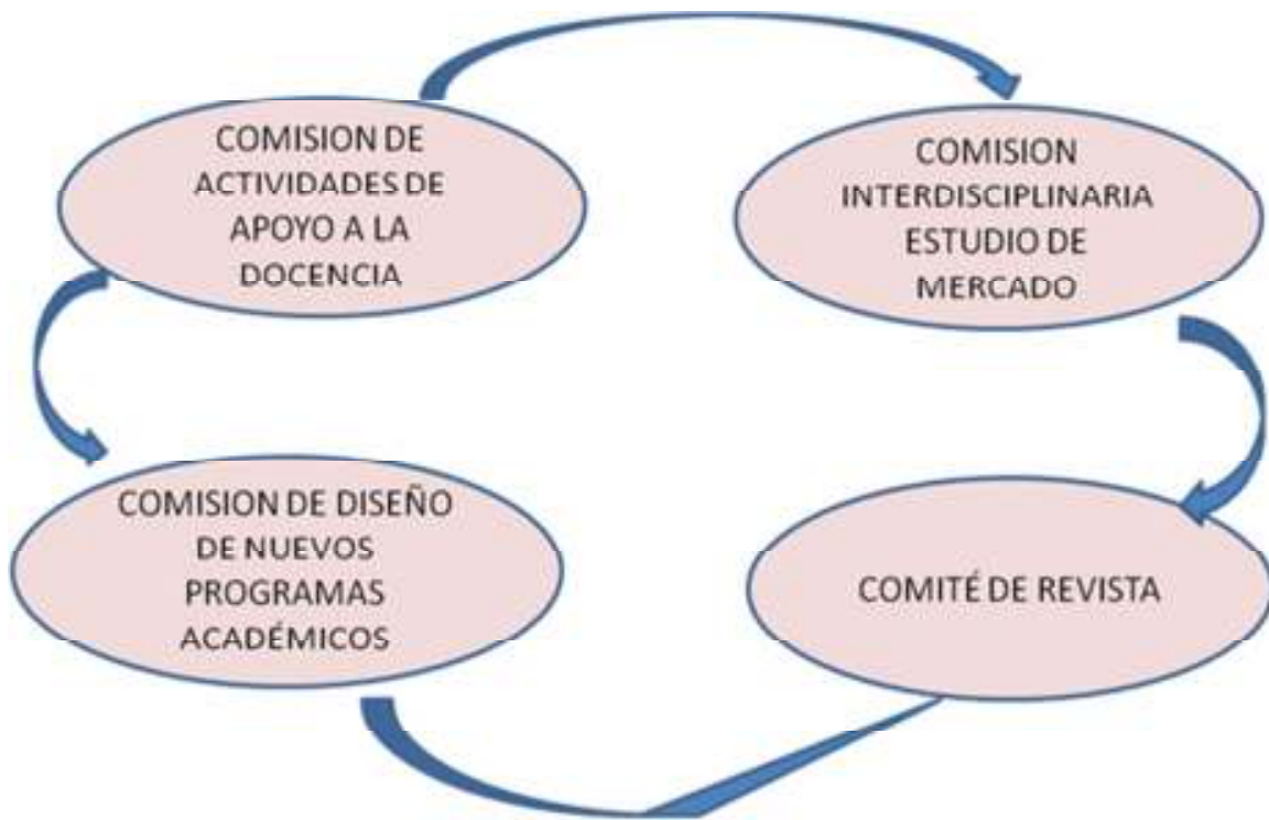
Ilustración 2: Estructura del Comité