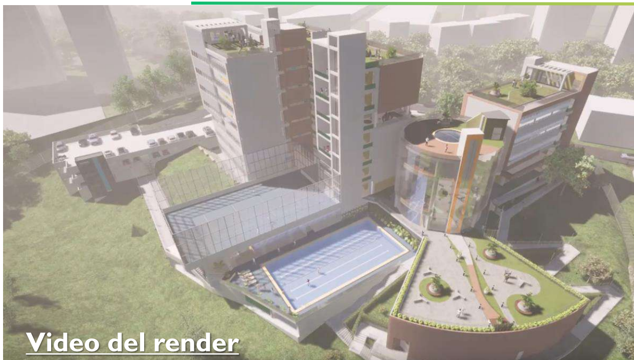
Video del render