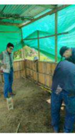
Foto 1 Corte 1 Excavación Arqueológica