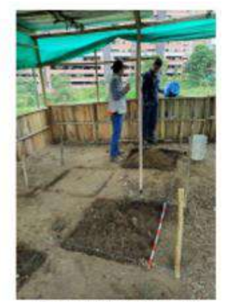
Foto 2 Cuadrícula del In X In - corte 1